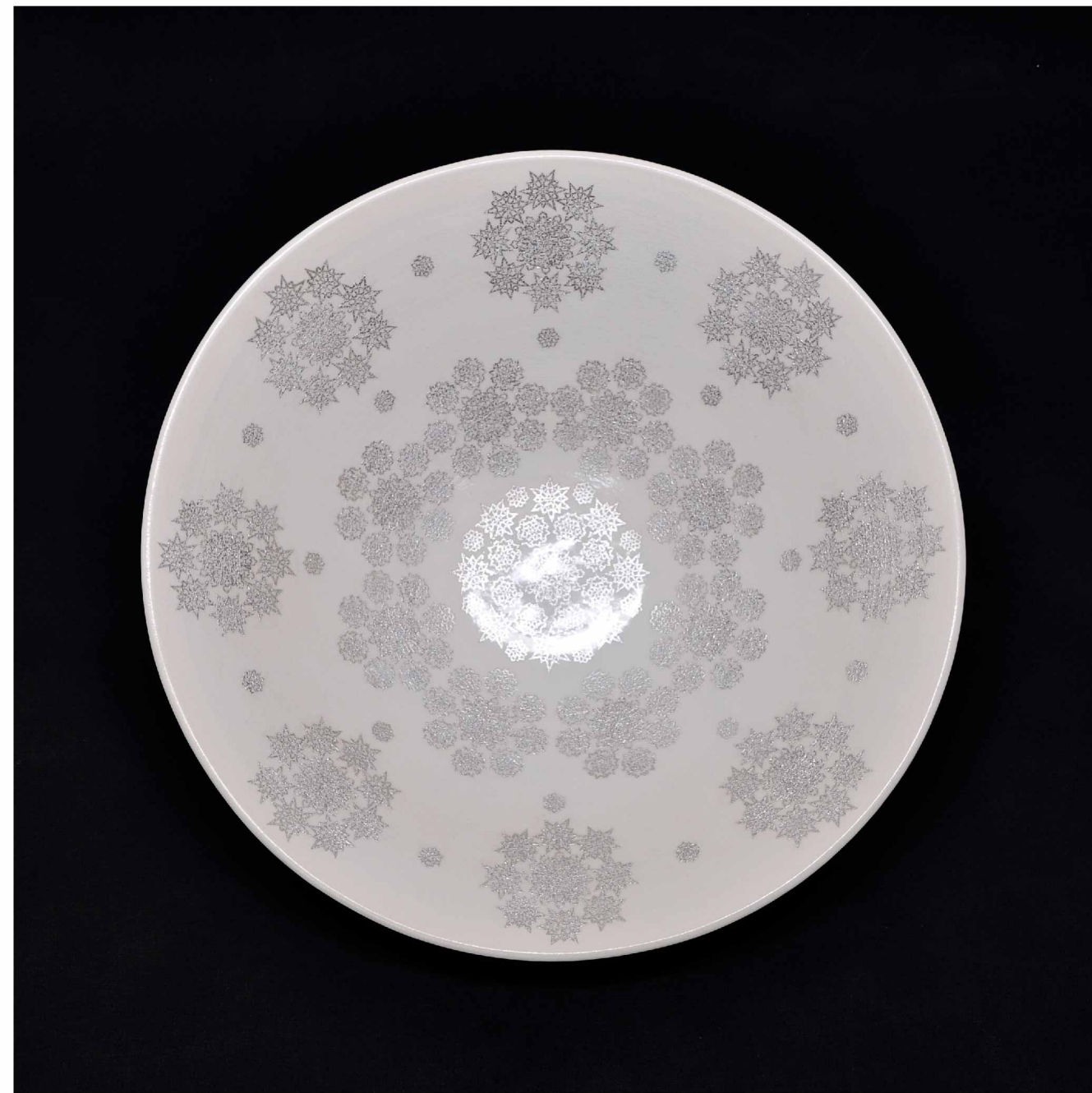
釉裏銀彩 幾何學紋 大皿, 130 × 450 mm