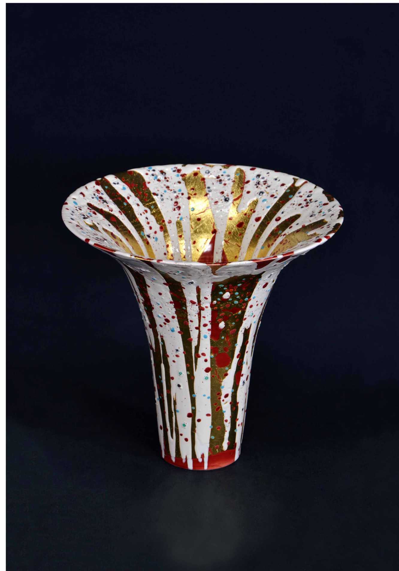
釉裏金銀彩 花瓶, 300 × 280 mm