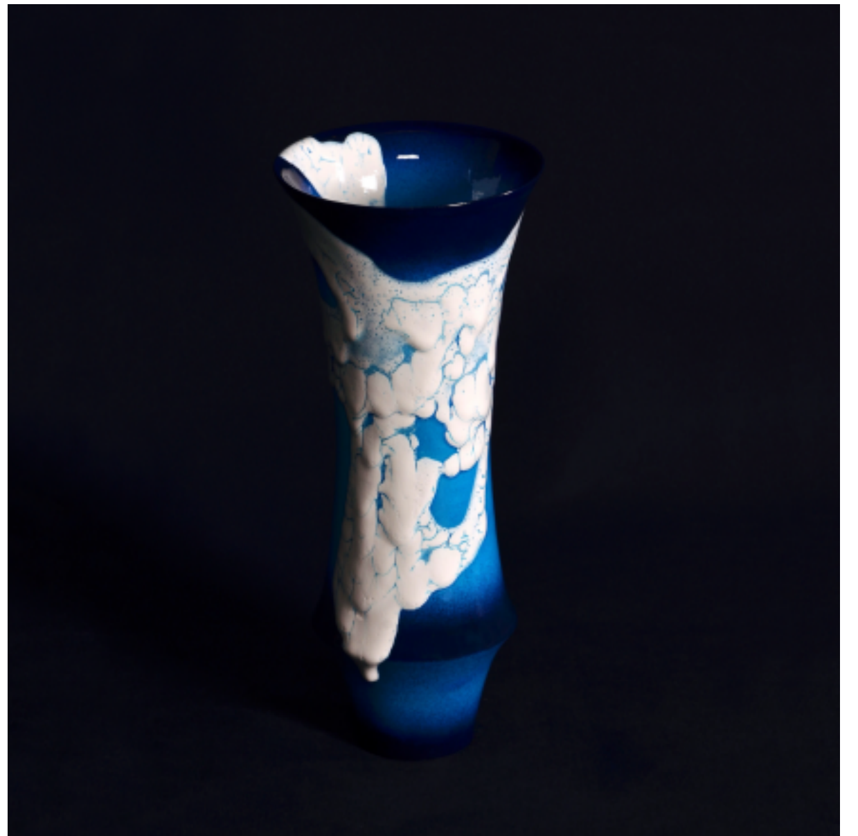
碧薩摩 蛇蝎釉 瓶, 400 × 150 mm

由嘉一窯的古垣彰弘創出糅合傳統與與革新的薩摩作品。薩摩燒的發祥地鹿兒島縣，為了將其特有的通透天空及海洋的表現出來，古垣彰弘將薩摩燒傳統的白色釉料混合自行開發的碧薩摩蛇蝎釉，獨創的藍色釉和傳統的白色釉混合以製作薩摩燒。「蛇蝎釉」，從字面看是以「蛇」和「蝎」的皮膚表面模樣創作的釉料，塗上二，三層不同的釉，因其收縮程度的差異而產生對比的形態。