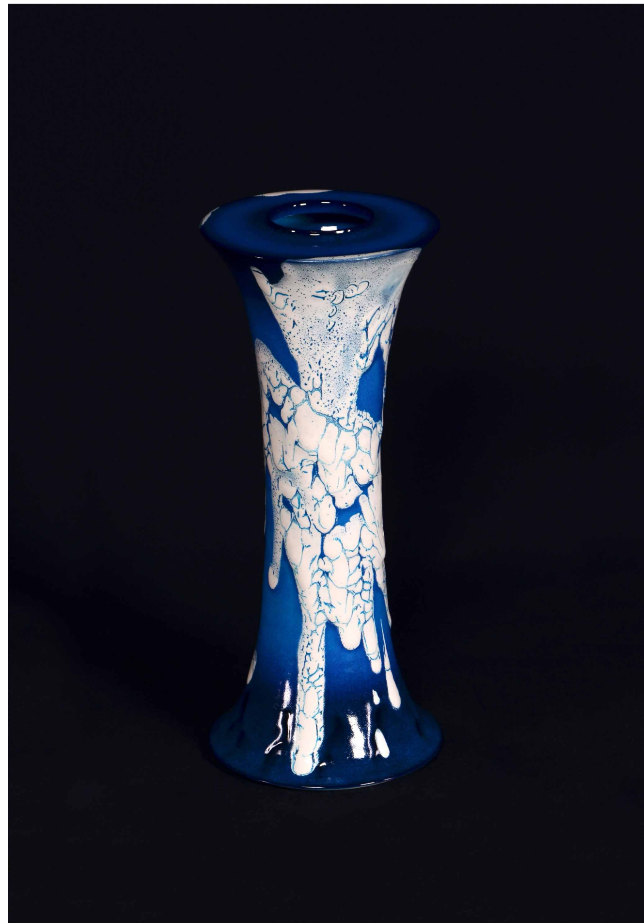
碧薩摩 蛇蜥釉 瓶, 390 × 155 mm