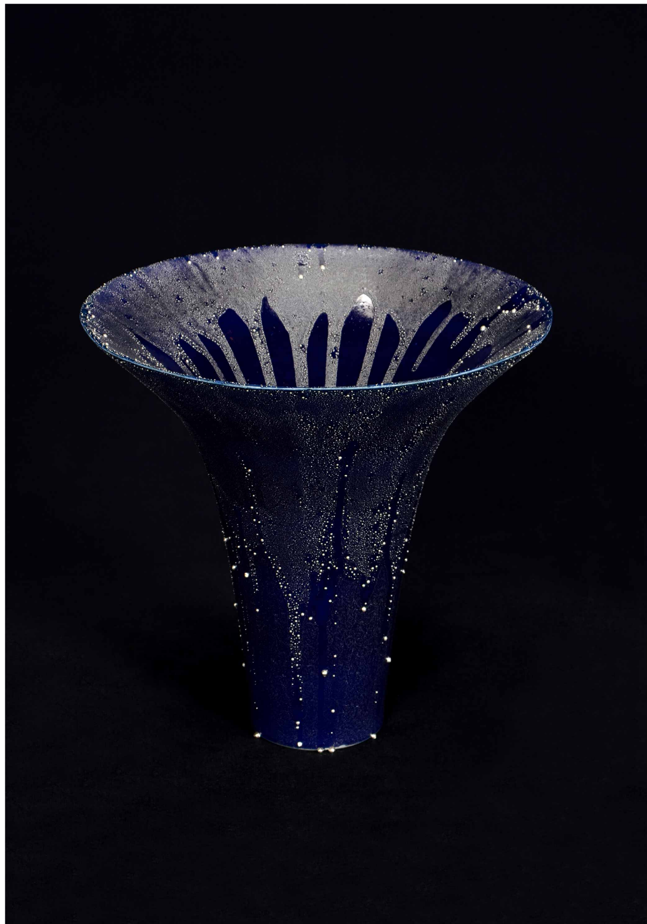
釉裏銀粒彩 花瓶, 300 × 280 mm