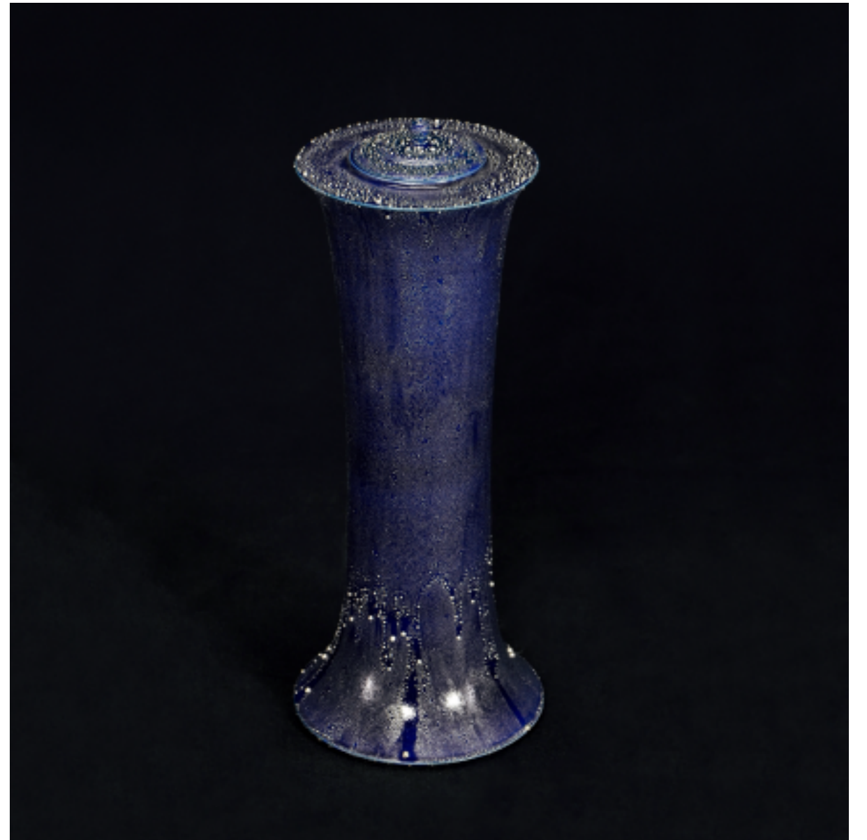
釉裏銀粒彩 花瓶, 390 × 155 mm

通常，銀箔以其形態附在陶坯一起燒製；而釉裏銀粒技術則是隨機貼上銀箔並以特殊的燒製方法，至使銀箔在過程中液化。覆蓋在陶器上的液化狀態銀箔猶如流動似的，精緻的凸起的顆粒狀圖案與透明釉相得益彰，互相輝映。釉裏銀粒技術是在燒窯過程失敗中，偶然發現的嶄新方法演變而成，能具體展現古垣彰弘獨特個人風格的昇華境界。