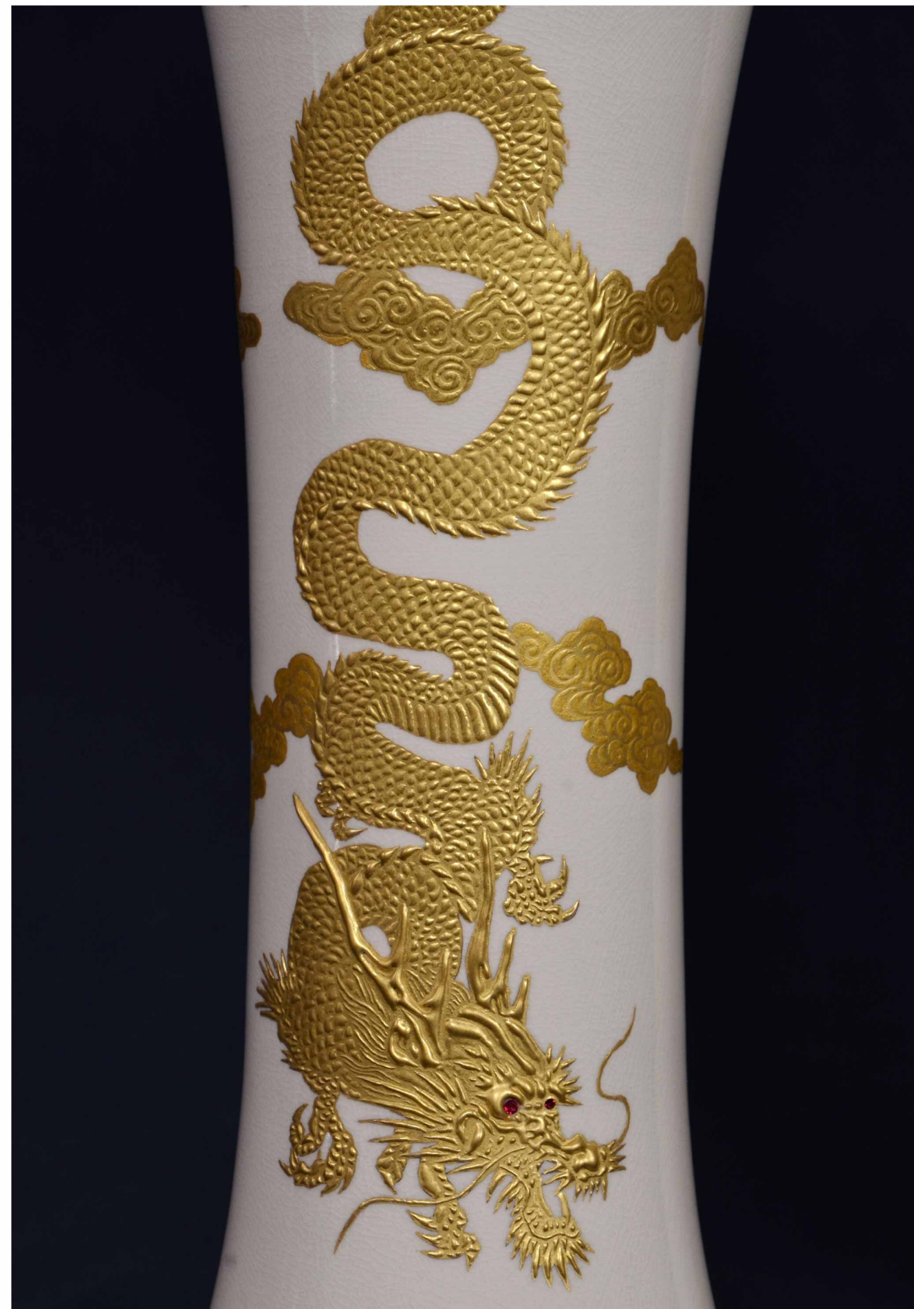
白薩摩 金鑲 雲龍圖 花瓶, 450 × 260 mm