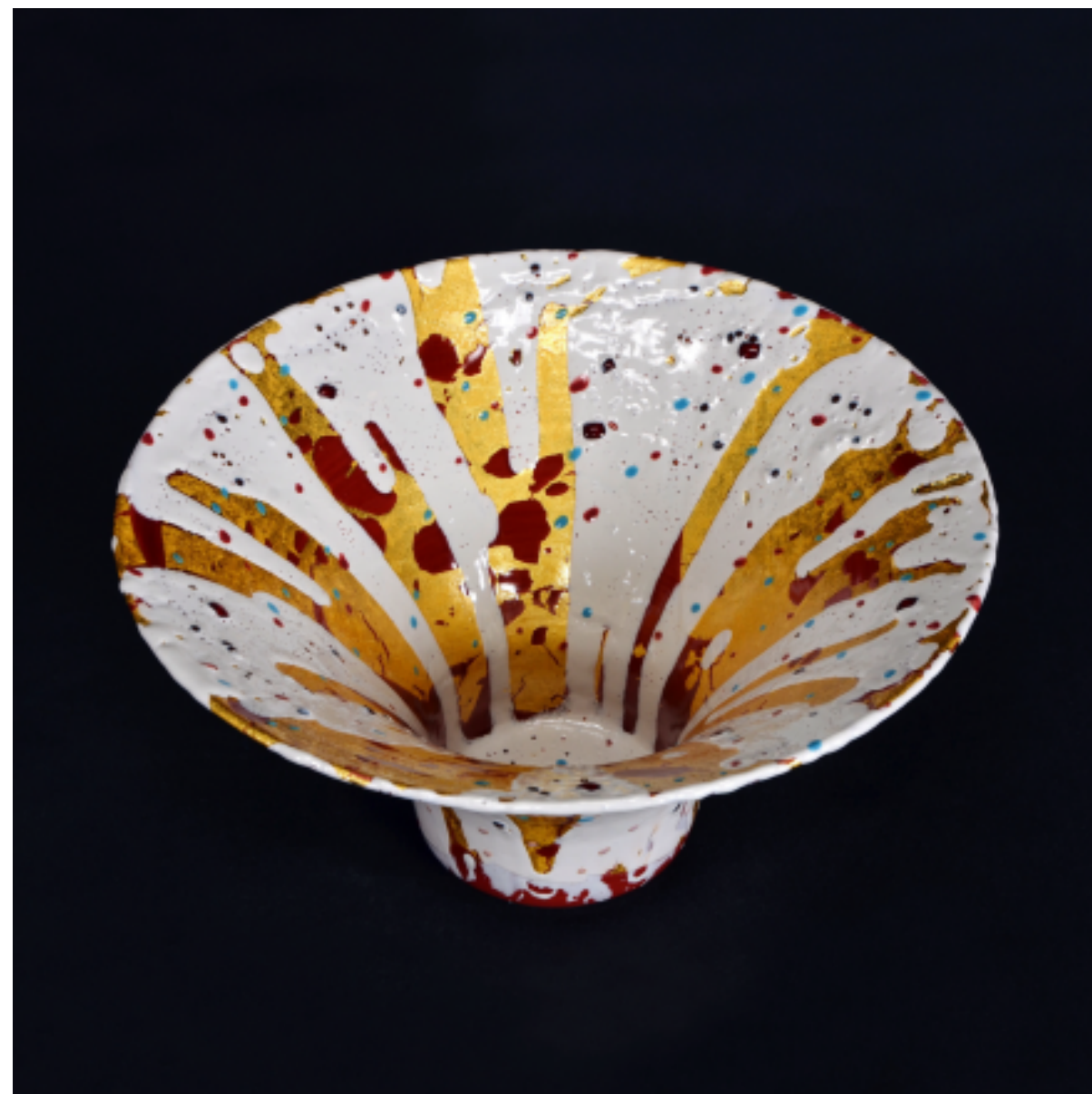
釉裏金銀彩 花瓶, 150 × 300 mm

薩摩燒的裝飾技術之一，將20世紀由日本始創的新技術融入薩摩燒之中。將金，銀箔裁剪成特定圖案並與陶坯一起燒製，於表面塗上透明釉料後再次燒製而成。銀箔上塗上透明釉形成塗層，可避免銀箔暴露在空氣中因硫化而變黑，以保持其亮麗的光澤。銀箔切割難度甚高，加上多次反覆燒製，各燒製階段均須精準的溫度管理，須要大量時間，精力，長年累月的經驗與技術。