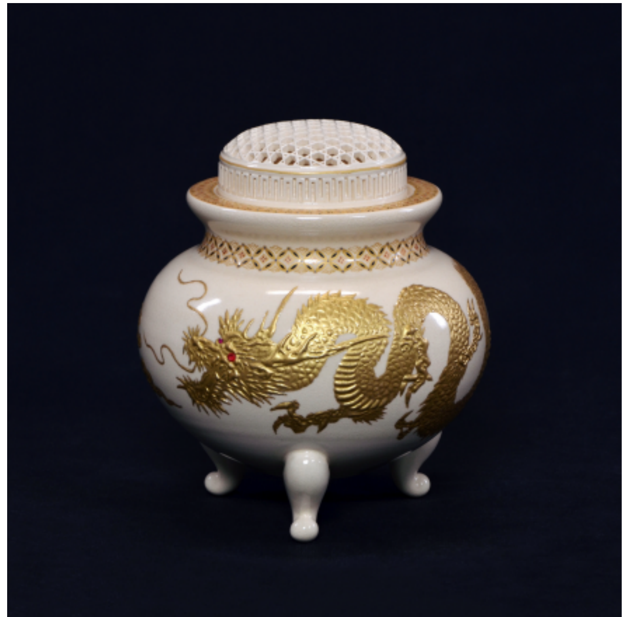
白薩摩 雲龍圖 透彫 香爐 , 300 × 280 mm

薩摩燒的透彫技術仍世上獨有。陶坯自轆轤拉出後，在尚未乾燥前以特殊的刀具開孔。不容絲毫瑕疵，須要極度專注和豐富經驗，並追求這種力臻極至技術的工匠才能做到。世上抱持著這種態度的工匠寥寥可數，更顯得這些作品彌足珍貴。