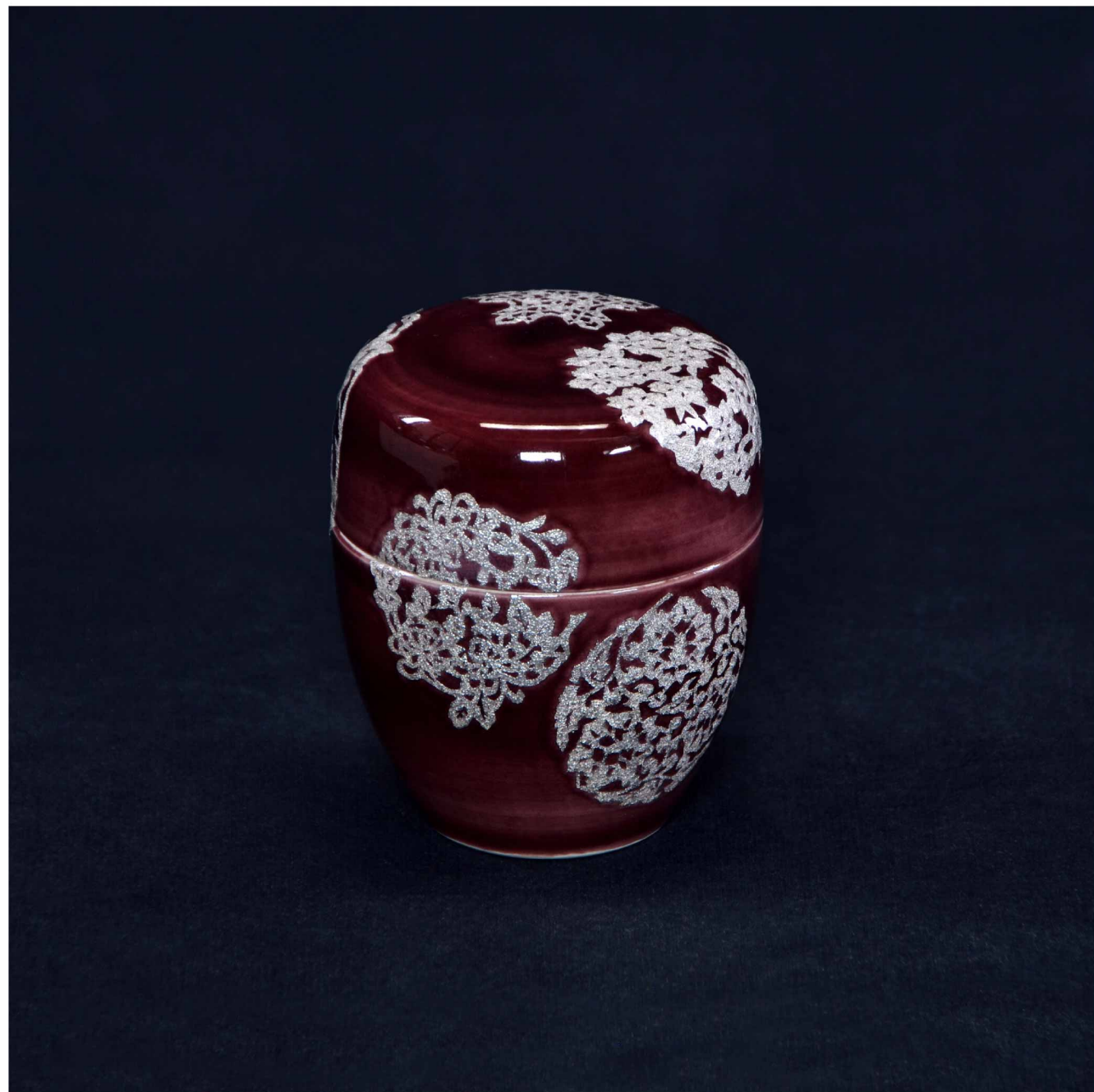
釉裏金銀彩 交織 銀箔手飾箱, 200 × 200 mm