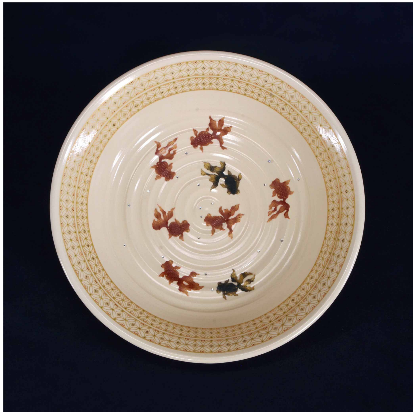
白薩摩 吉祥金魚圖 水盤, 80 × 300 mm