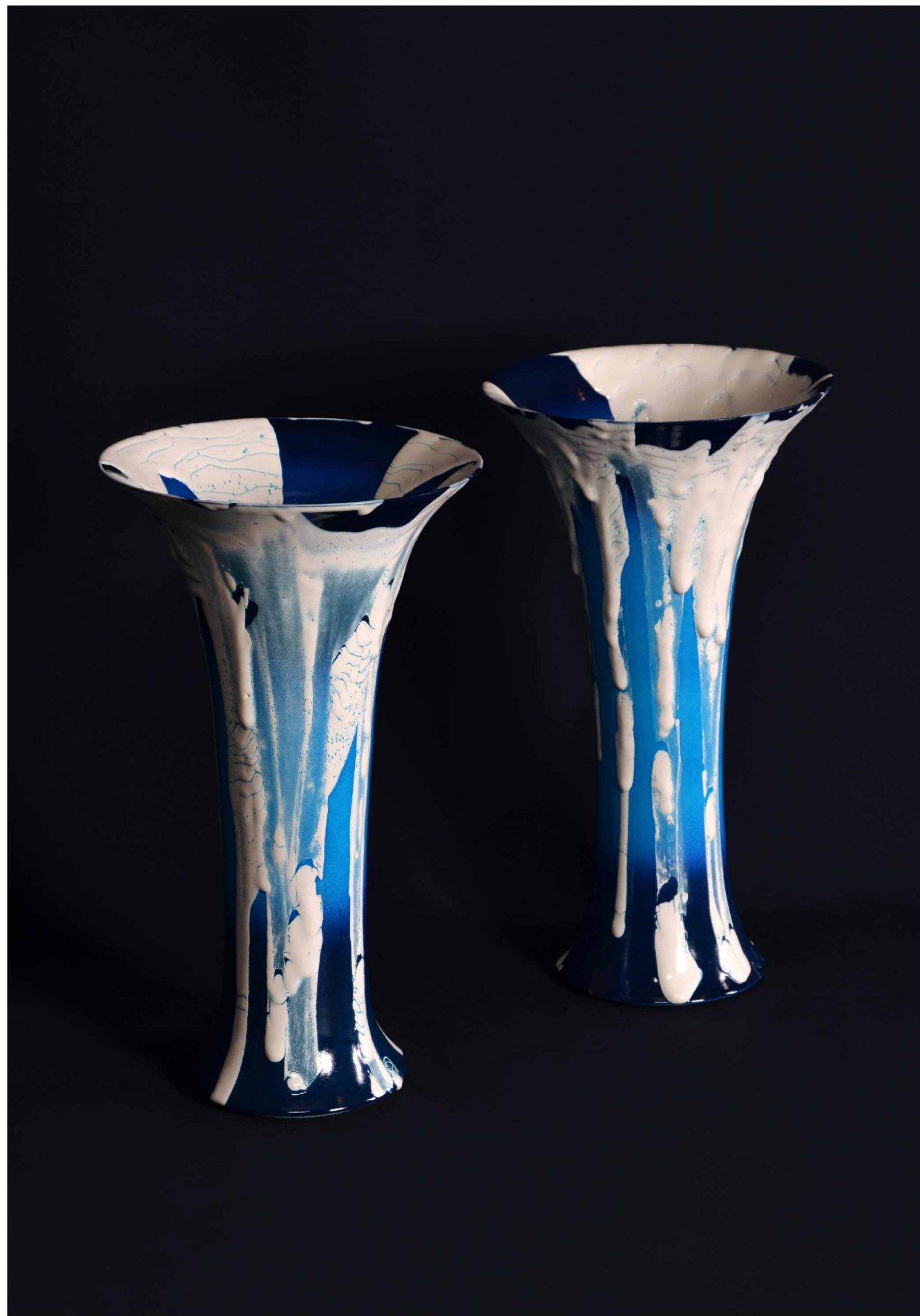
碧薩摩 蛇蜥釉 花瓶, 450 × 250 mm