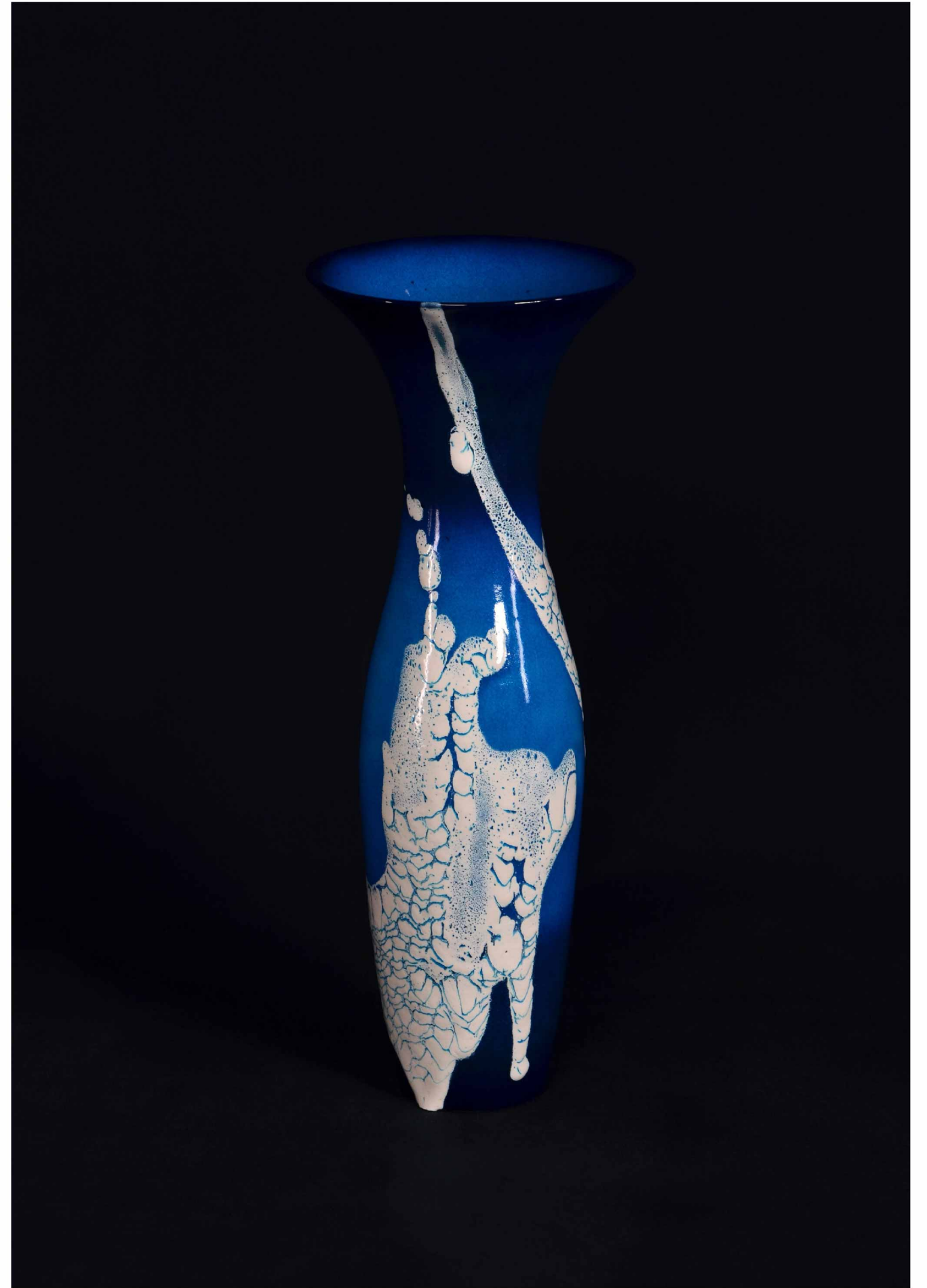
碧薩摩 蛇蝎釉 瓶, 320 × 140 mm