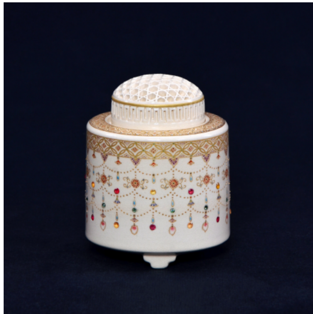
白薩摩 璣珞紋 透彫香爐, 110 × 80 mm

璣珞紋圖仍指古代印度貴族身上配戴的飾物（手飾）中象徵帶來富貴吉祥的圖案。嘉一窯的璣珞紋樣繪畫纖細精巧，將真正的寶石或水晶等以獨特的方式嵌入製作，創製出獨有風格，隨著欣賞角度不同，不規則的反射讓人有彷彿看到裝飾品覆蓋在作品上的真實印象。