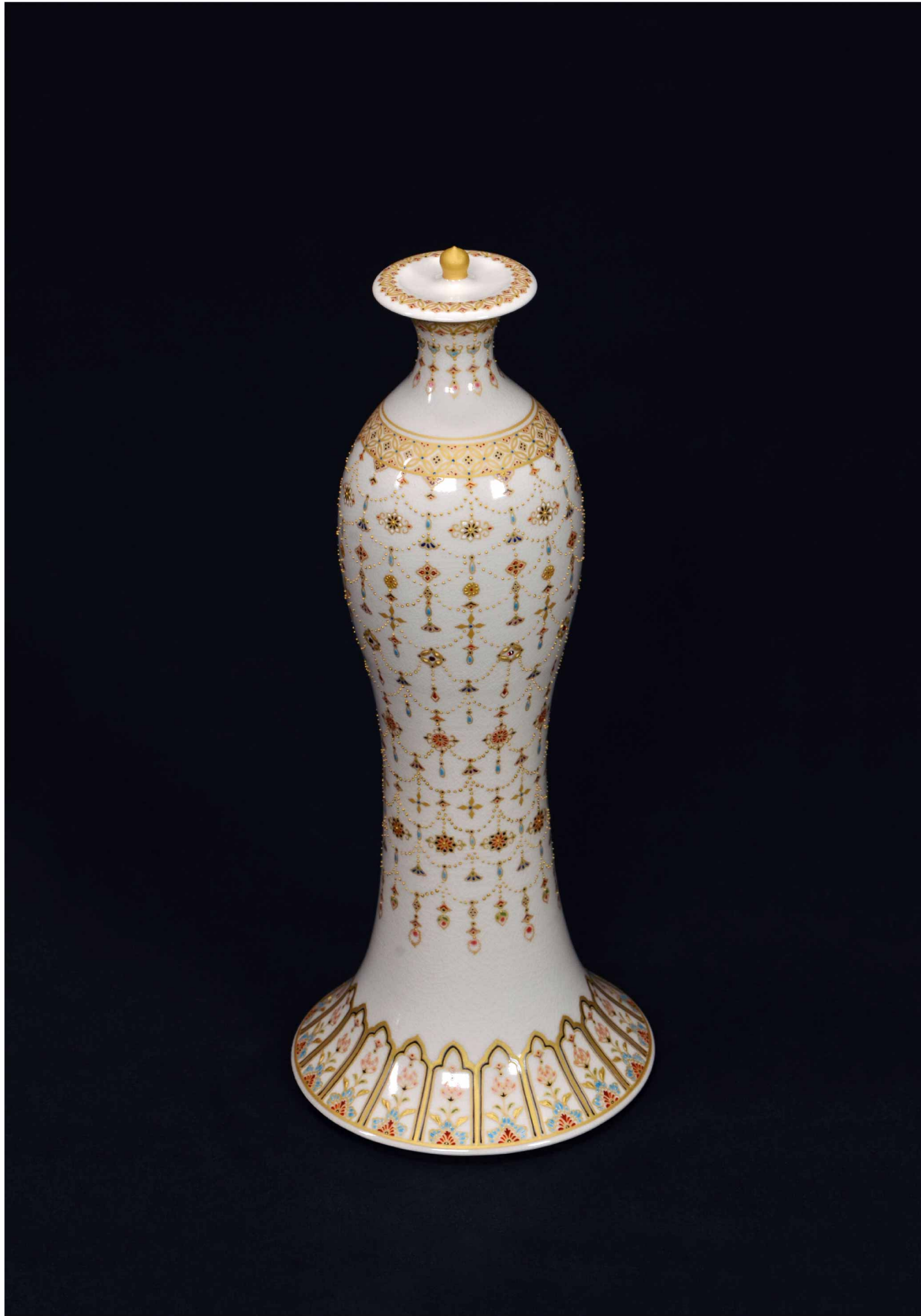
白薩摩 金襴手璆珞紋 瓶, 360 × 160 mm